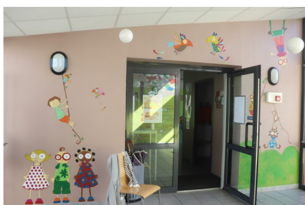
Photos des peintures faites dans le hall garde-rie / bibliothèque lors de la journée citoyenne

Société retenue : HTPYRO de Guichen (35) pour la somme de 2 685,56 € TTC