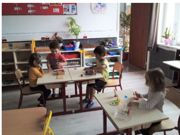
Et ceux de maternelle