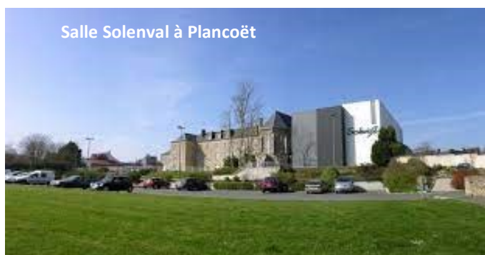
Salle Solenval à Plancoët